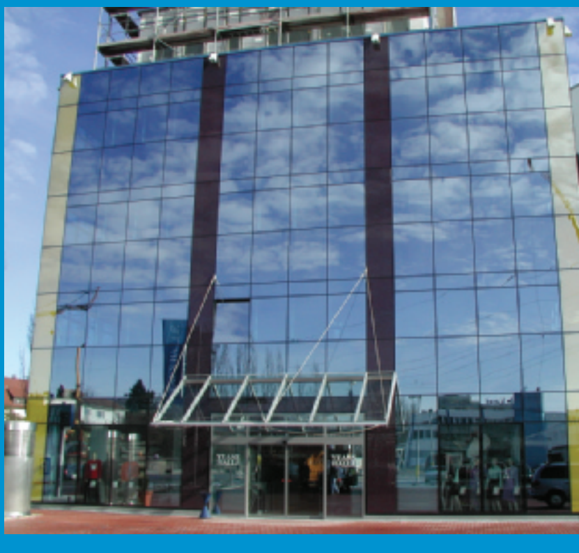
Cristal Carree - Sindelfingen - Allemagne - Stopsol Supersilver Dark Blue

Grâce à sa couche pyrolitique, le verre Stopsol est très facile à transformer. Il peut être durci, trempé, bombé, émaillé, sérigraphié et installé en simple et double vitrage. Stopsol est devenu le verre de prédilection pour de nombreux architectes et promoteurs à travers le monde.