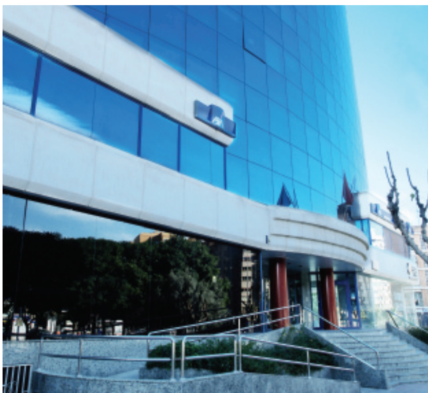
Banque AXA - Murcia - Espagne - Stopsol Supersilver Dark Blue