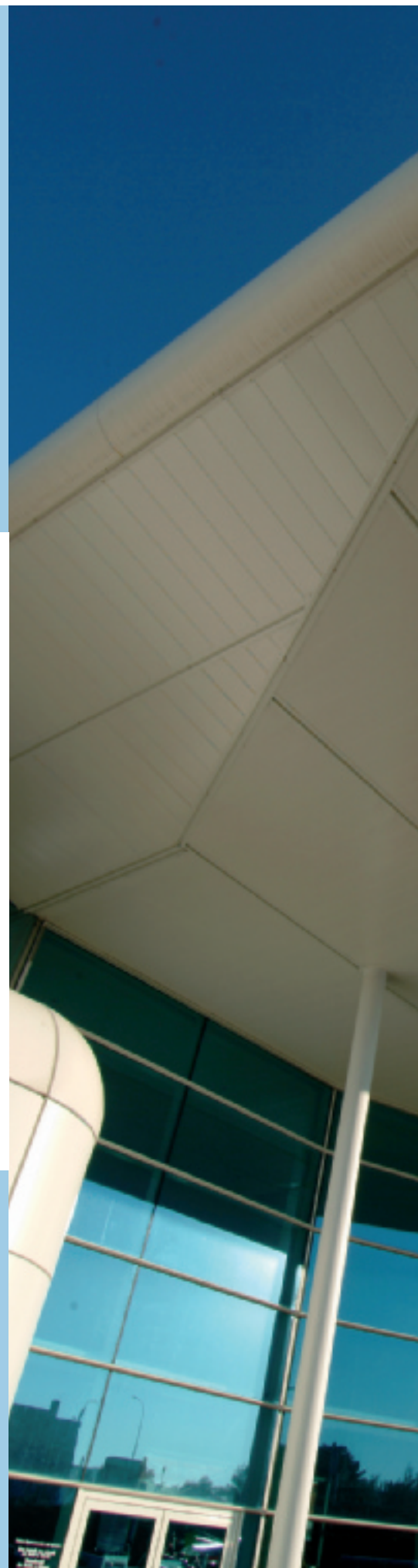
Photo couverture: Bâtiment Tasmajdan, Belgrade, Serbie - Stopsol Silverlight PrivaBlue