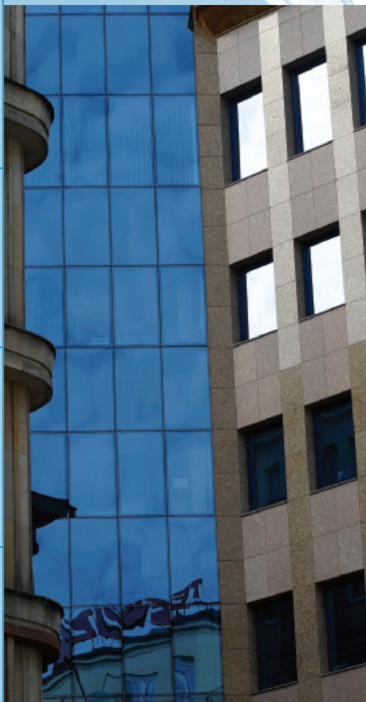
Telecomunikace II - Varsovie - Pologne - Supersilver Dark Blue

Pour plus d'informations, nous vous invitons à consulter les Guides de transformations Stopsol en surfant sur www.YourGlass.com