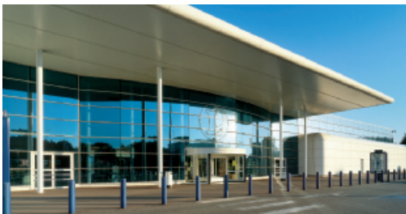
Bâtiment Leclerc, Neufchâteau, France - Stopsol Supersilver Dark Blue

N'écrivez jamais sur le revêtement du vitrage. N'utilisez pas non plus d'outils de découpe, d'outils pointus ou d'outils durs qui pourraient endommager le revêtement.