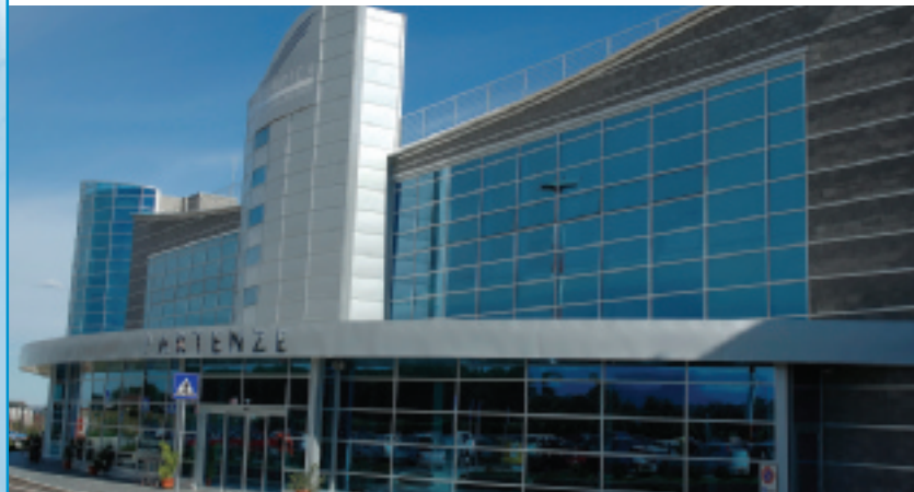
Aéroport de Cuneo, Italie, Stopsol Supersilver Dark Blue

Si la couche est placée à l'extérieur (#1), elle influencera la teinte et augmentera la réflexion extérieure. Si elle est placée à l'intérieur (#2), la couleur sera davantage influencée par la couleur du float.