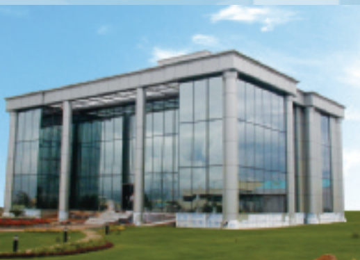
Bâtiment Disa - Bangalore - Inde - Stopsol Supersilver gris